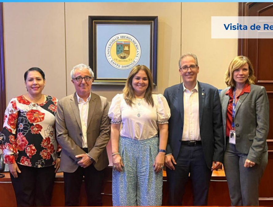
Visita de Representante de Universidad de Barcelona