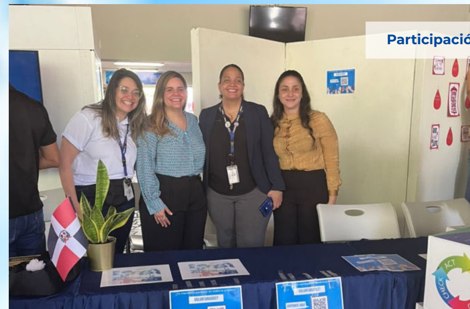
Participación de la VVI en los grupos estudiantiles